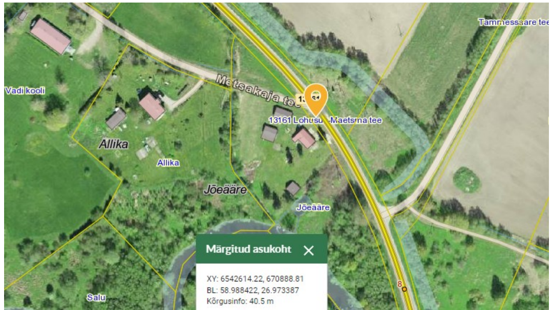
Joonis 1. Bussipeatuse orienteeruv asukoht tähistatud oranži tingmärgiga.